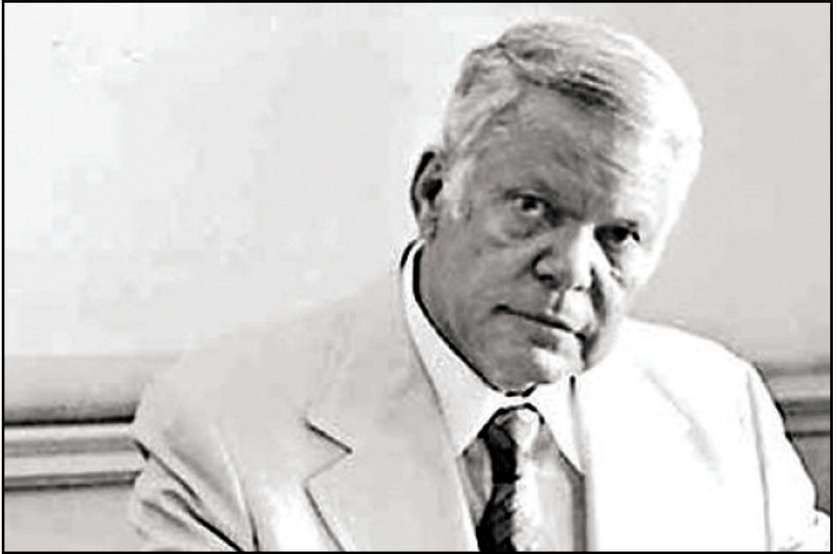
الفارس الشهيد يوسف السباعي بنظرته المتفحصة لمعادن الرجال ومعاني الأحداث ومضامين الأشياء