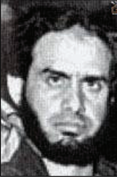
الإرهابي شكري مصطفى زعيم تنظيم «التكفير والهجرة»