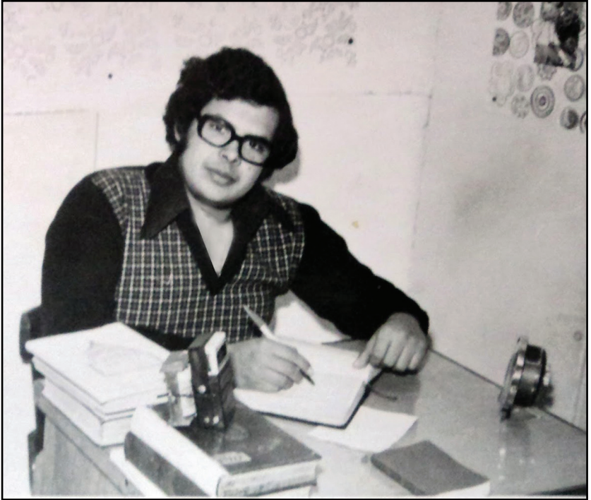
.. وسكنت غرفة صغيرة وأنيقة بالمدينة الجامعية