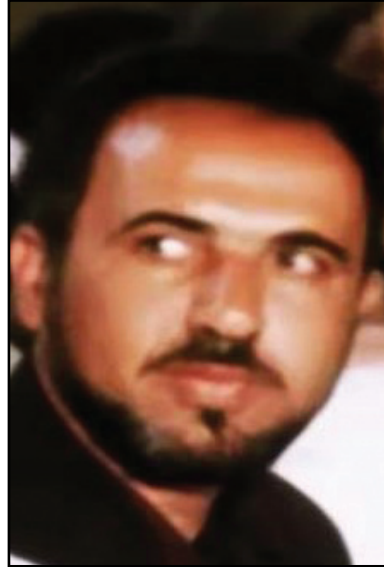
الإرهابي صالح سرية زعيم تنظيم «الفنية العسكرية»