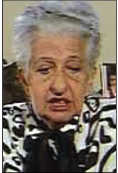
د. سهير القلماوي