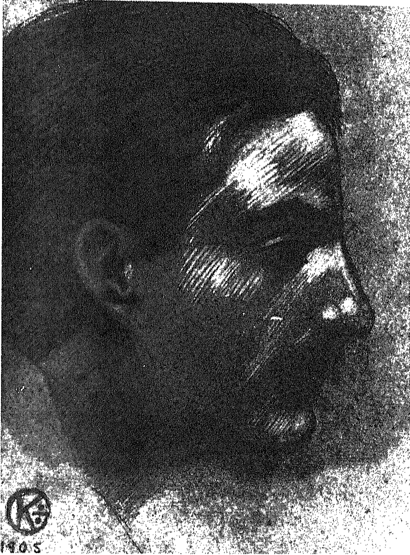
صورة الغلاف: وجه جبران بريشته - ١٩٠٥ م.