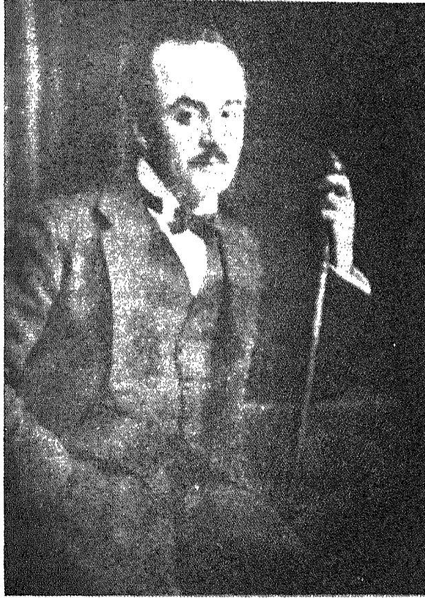
آخر رسم لجبران خليل جبران - صورة شمسية عمل ج. و. هوبي نيويورك نقلاً عن مجلة السائح ممتاز ١٩٢٣ .