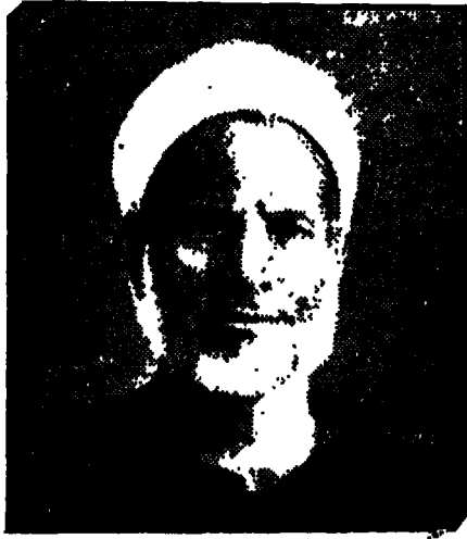
له حضرة صاحب الفضيلة الواعظ الكبير الشيخ علي محفوظ عضو جماعة كبار العلماء بالأزهر الشريف