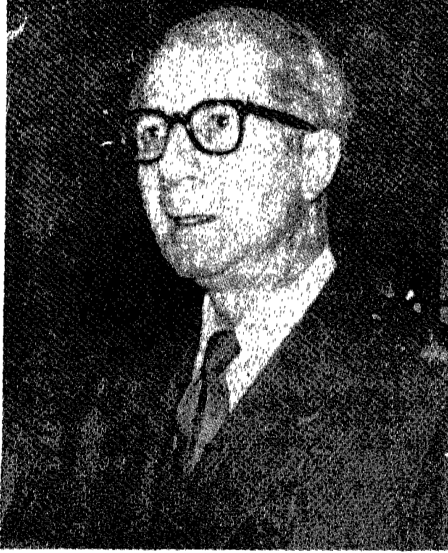
دولة المغفور له سمير باشا الرفاعي

وكان سمير ذا شجاعة وعزم بالاضافة الى ميزته السياسية الحساسة، إلا أنه بالحقيقة كان يجابه عائقين هما: أولاً أنه كان معروفاً جداً بهويته السياسية في الجناح اليميني من المحيط السياسي الاردني ، وكذلك أيام الملك عبد الله، وجلوب، والعلاقات