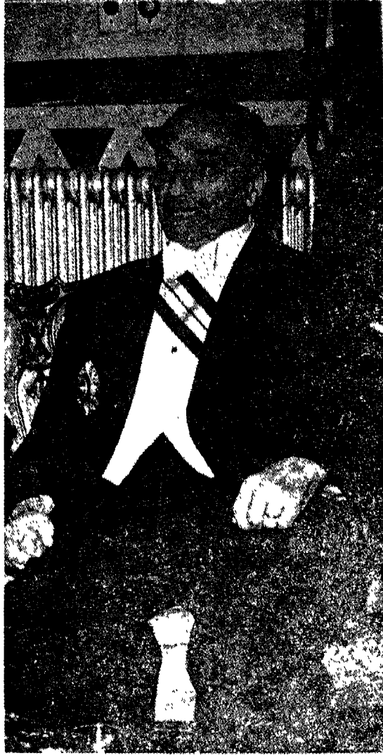
دولة المرحوم بهجت التلهوني

وفي اليوم الثامن من نيسان وبعد الالتفاف الى الحوادث الماضية، ظهر أنه قد حصل ما يشبه الاجهاض لمحاولة أولى لانقلاب عسكري. وقد ظهرت في عمان سيارات مصفحة جاءت من الزرقاء وأخذت مواقعها حول قصر الملكة الوالدة، وفي مواقع أخرى حساسة خارج ضواحي المدينة، ومن المؤكد أن أمر هذه السيارات كان من ضمن المؤامرة كما ظهر بعد ذلك. وكان من المحتمل أن تكون هذه محاولة حمقاء وسخيفة