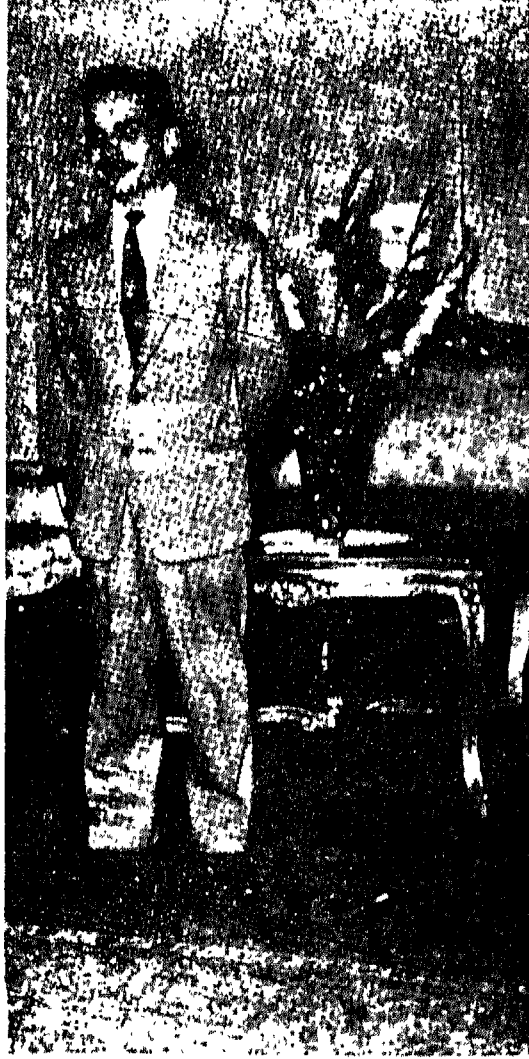
جلالة الملك حسين بن طلال (١٩٥٦) في عز شبابه واول ايام حكمه في الأردن

وخلال حديثي معه بعد ذلك، وجدت نفسي مكتنفاً بستارة كثيفة من اللطف