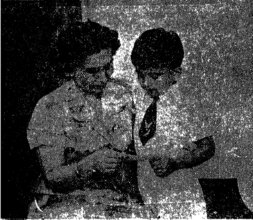
جلالة الملكة زين الشرف المعظمة ومعها سمو الأمير حسن (١٩٥٦)

والمجاملة العربية.. " نأمل ان تكون سعيداً بيننا، ونأمل ان تكون عائلتكم بخير وهكذا مع سلسلة لا نهاية لها من ادب الحديث اللبق، ولقد تبين لي بوضوح، ان الملك كان يخفي وراء اخلاقه الهاشمية الطيبة، تصميمه على الاحتفاظ بمسافة كافية حد بيني وبينه، حتى انني تصورت بانه من الصعوبة بمكان عظيم خلق علاقة قريبة معه، وكان هذا بالحقيقة يمثل غضبه وامله حول تصرفاتنا في السويس، اكثر من اى وزير او تابع له من العاملين ضد بريطانيا.