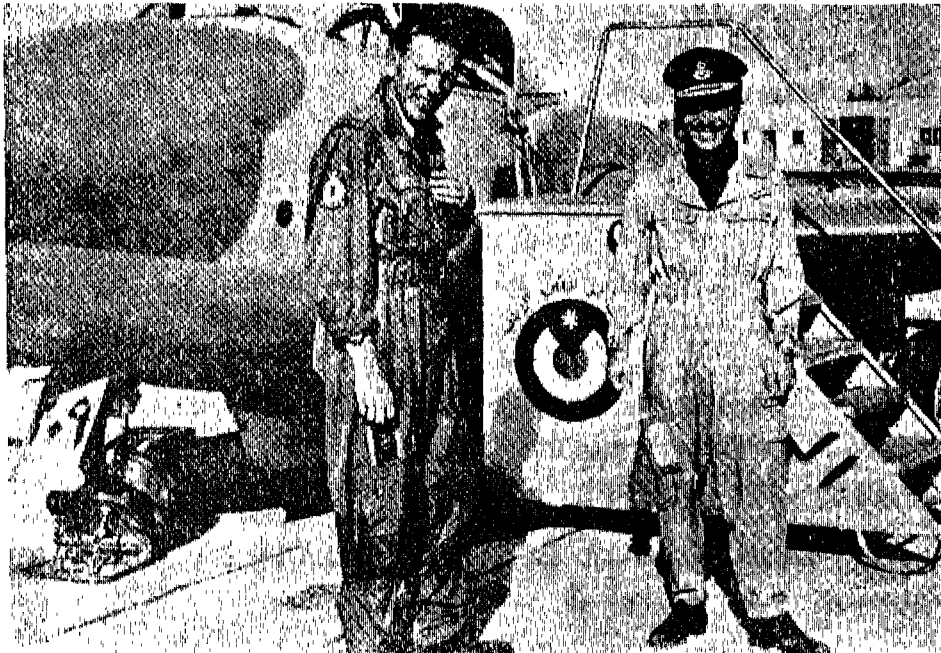
جلالة الملك حسين وقائد الجناح الطيار دالجليش

ولم يكن هناك شكّ في أن خطة سوريا كانت إجبار الملك على الهبوط في دمشق وإرغامه على التنازل عن عرشه، وبهذا يتمكّن ناصر من الاستيلاء على البلاد (١) ومن المؤكد أن سلامة الملك حسين كان مرجعها إلى ضبط أعصاب ومهارة جوك دالجليش «الذي جاءني بعد هبوطه مباشرة وحدّثني بتفاصيل ما جرى. وقد بدت هذه المخاطرة أشد وحشيّة، عندما حدّثني بها هذا الرجل الشديد الهدوء بصوته الأجنس ولكنته الاسكتلندية (الادنبرية) الدقيقة.