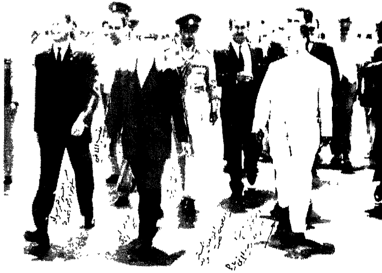
من الشمال إلى اليمين، المستر همرشولد عند وصوله إلى مطار عمان، دولة الغفور له سمير الرفاعي، والمترجم الذي كان في تلك الفترة مديراً لمطار عمان المدني.

وفي السادس من شهر سبتمبر وبتعليمات من لندن، أعلمتُ سمير باشا أن الحكومة البريطانية كانت مستعدة لمنح الأردن مساعدة للموازنة في السنة المالية الحالية بما مقداره مليون جنيه استرليني. وكان هذا المبلغ بالإضافة إلى مبلغ الـ (٦٣٠٠٠٠٠) جنيه الذي أعدناه للاردن خلال العام، بدون فائدة وكقرض للتنمية، وكذلك إلى تأجيلنا دفعه مبلغ الـ (٥٥٠٠٠٠٠) جنيه والذي استحق لنا على الأردن في ١/مايو، بموجب تسوية المعاهدة، وكذلك استثمارنا في تحمّل كفالة الأردن بدفع التعويضات لموظفي حكومة فلسطين السابقين، والتي تكلفنا نصف مليون جنيه تقريباً خلال العام، جميع هذه الانباء حملت شعوراً بالراحة التامة للحكومة الأردنية، وبالتالي للملك الذي اعتبر هذا الحل بمثابة تفهّم لوضع الأردن المالي.