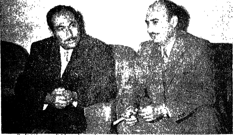
المشير حابس المجالي بالملابس المدنية يجلس مع الخفور له دولة السيد هزاع المجالي

القحط في موسم الحصاد التالي السيء. وبالمساعدة الفورية من بريطانيا والولايات المتحدة، تمكّن الاردن من الصمود والتغلّب على هذه النكبات. وبنفس الوقت بدأ العمل بسرعة في تطوير تلك الموجودات التي تمتلكها البلاد. وقد تم العمل في ميناء العقبة الجديد وافتتح بالاحتفالات واستمر العمل بالطريق الصحراوي الذي يصلها بالبلاد من الداخل بقفزات ووثبات... وبنفس أهمية هذين المشروعين البريطانيين، فقد تبنّى الأمريكيون مشروع