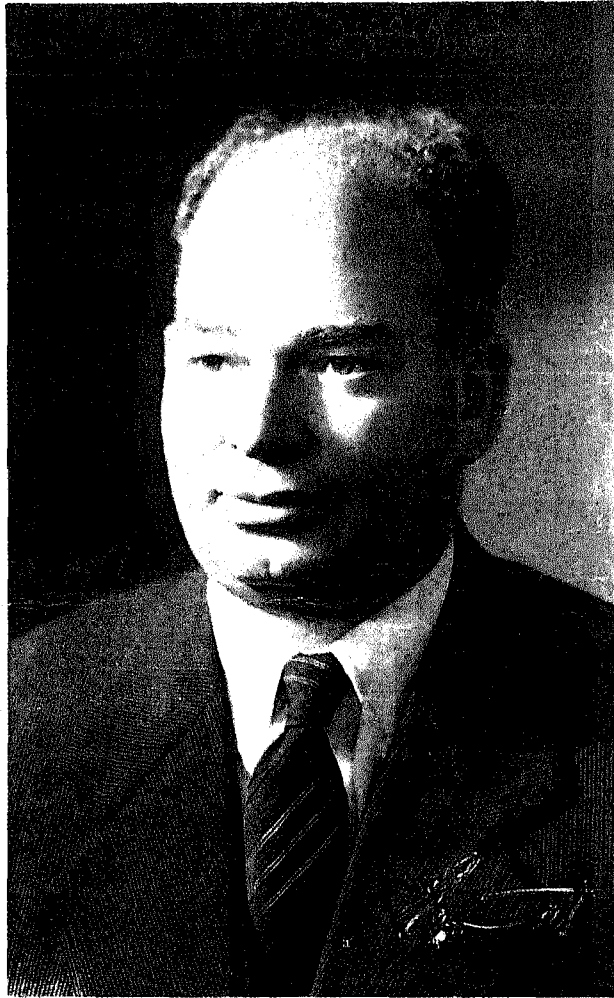
د . توفيق الطويل ( ١٩٠٩ - ١٩٩١ )