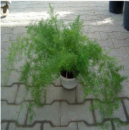
نبات الاسيرجس الناعم