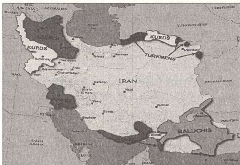
الشكل (1): خارطة إيران وتوزيع الأقاليم المذكورة في الدراسة.

بالنسبة لأهل السنة في المناطق الجنوبية على الساحل الشمالي والشرقي للخليج العربي، وفي جزره المهولة، فإن السائد في تلك المناطق المنهج السلفي وجماعة الدعوة والتبليغ. ويجري العمل الدعوي فيها بواسطة الدعاة والمشايخ الذين يديرون نشاطهم من خلال المدارس الدينية حيث تكمن الزعامة الدينية هناك في مدرسة الشيخ سلطان العلماء، التي مركزها ميناء «لنجة».