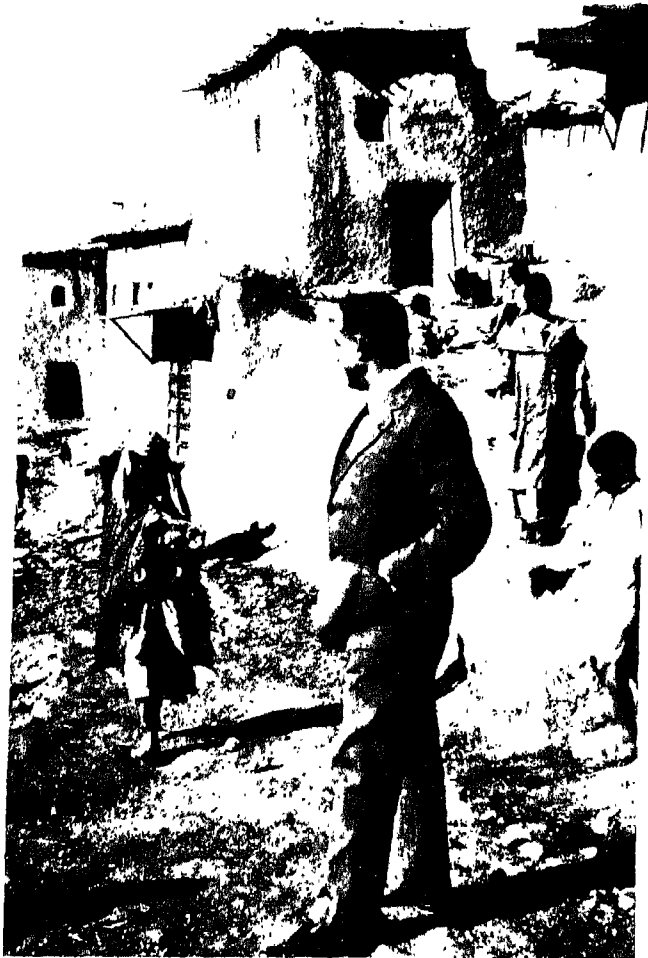
في المغرب عام ١٩٣٣