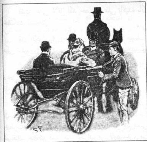
Sydney Paget 1892

لاحظت أن هولمز مسرور جداً، فقد قهقهه وفرك يديه ثم قال وهو يضغط على يدي: إنه تخمين موفق يا واطسون، تخمين موفق جداً.