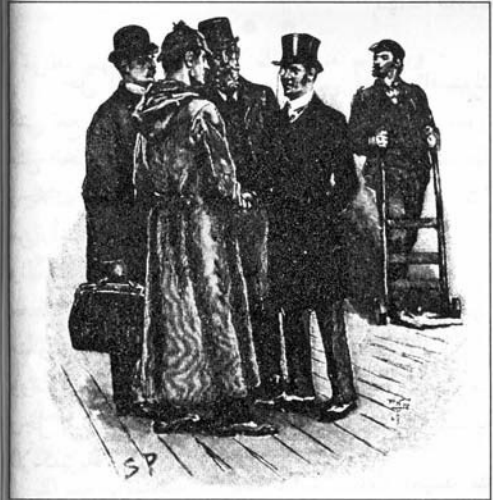
Sydney Paget 1892

بسرعة في شوارع مدينة ديفونشاير القديمة الجذابة. كان المفتش غريغوري غارقاً في قضيته وأغدق علينا سيلاً من الملاحظات، أما هولمز فقد ألقى بعض الأسئلة العرَضية والملاحظات الاعتراضية. ورجع الكولونيل روس إلى الخلف وقد عقد ذراعيه وقبعته تغطي عينيه، أما أنا فقد استمعت باهتمام إلى الحوار الدائر حيث كان غريغوري يصوغ نظريته التي كانت تشمل تقريباً كل ما قاله هولمز في القطار سابقاً.