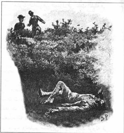
Sydney Paget 1892

وبعد تعافيه من غيبوبته كان هنتر متأكداً تماماً من أن ذلك الغريب كان يملك ربطة العنق تلك، كما كان متأكداً أيضاً من أن الغريب هو الذي دس المخدر