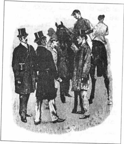
رسم سندي باجيت ١٨٩٢

بعضها من بعض، وفي منتصف الطريق ظهر الحصان التابع لحظائِر مابلتون في المقدمة، ولكن قبل أن تصل إلينا على أية حال قلّ جهد ديسبورو في حين تقدّم حصان الكولونيل فجأةً وعبر نقطة النهاية متقدماً على منافسه بست مسافات، في حين حلّ إيريس حصان الدوق بالمورال في المركز الثالث بشكل سيّئ.