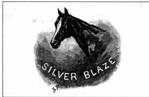
Sydney Paget 1892