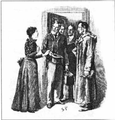
Sydney Paget 1892

- ثلاث منها إيصالات استلام خاصة بحساب أجّار التبن، وواحدة فيها تعليمات من الكولونيل روس، وهذه الورقة الأخيرة هي كشف حساب باسم ويليم ديربشاير صادر من محل مدام ليسوريه للقبّعات في شارع بوند، وهو بمبلغ سبعة وثلاثين جنيتهاً وخمسة عشر شلناً. وقد قالت السيدة ستراكر إن السيد ويليم ديربشاير صديق لزوجها وإنه يستلم خطاباتة عن طريق زوجها في بعض الأحيان.