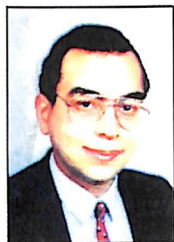
د. أحمد خالد توفيق