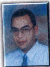
د. أحمد خالد توفيق

حقًا يوجد الكثير من الشر في هذا العالم .. لكن الخير ما زال يملك الكلمة الأخيرة ، أو - على الأقل - ما زال يملك الحكم على الأشياء : هذا حسن .. هذا شرير .. في عالمنا ثغرات تقود إلى جانب النجوم الرهيب ، حيث أسوأ كوابيسك تتحقق ، وحيث يملك الشر وحده أن يصك الأحكام ، وحيث القسوة هي اسم اللعبة .. ماذا يفعل (رفعت إسماعيل) في عالم كهذا ؟ .. وكيف يستطيع الفرار أو يحلم به ؟