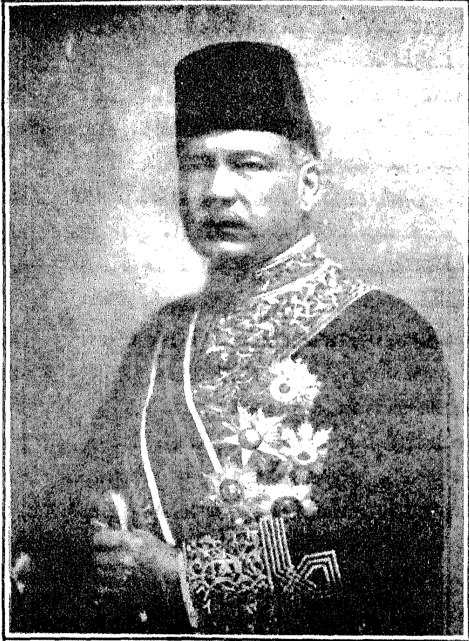
عبد الخالق ثروت باشا