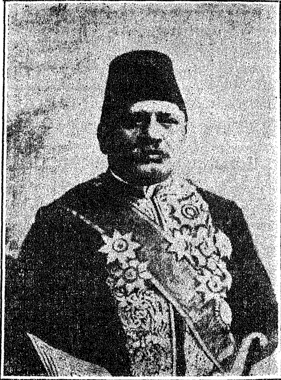
بطرس باشا غالی