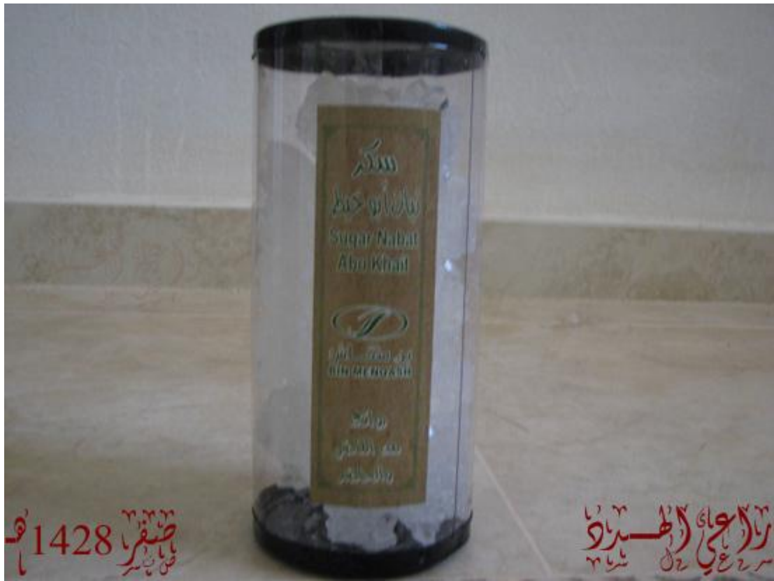
4- شبة بيضاء