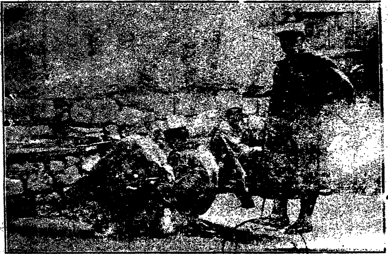
كولونيل فرسي من فرقة المنييه مع جنوده يصوب نيران مدفعية على الثوار