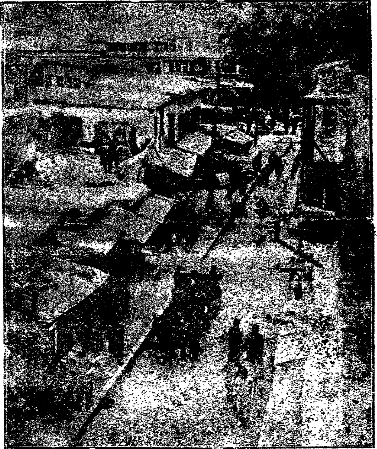
أكبر ميادين مدينة دمشق التي دمرتها الطائرات