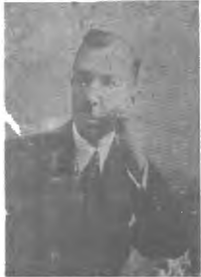
ملك الشعرا بهار