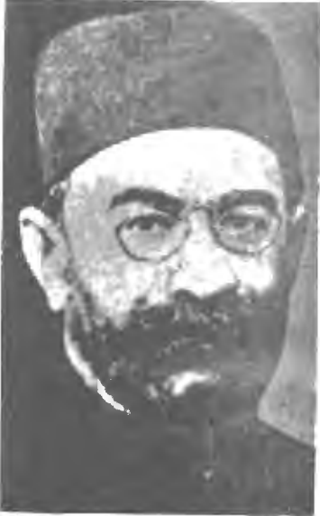
محمد علي فروغی