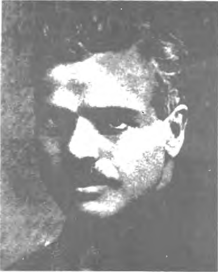
أبو القاسم لاهوتي