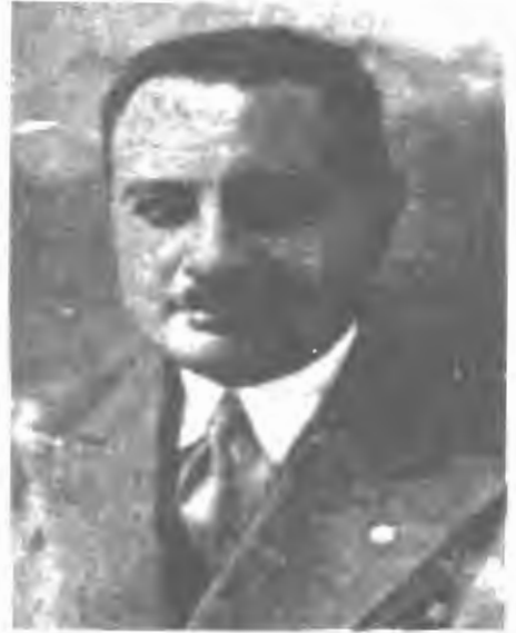
على أصغر حكمت