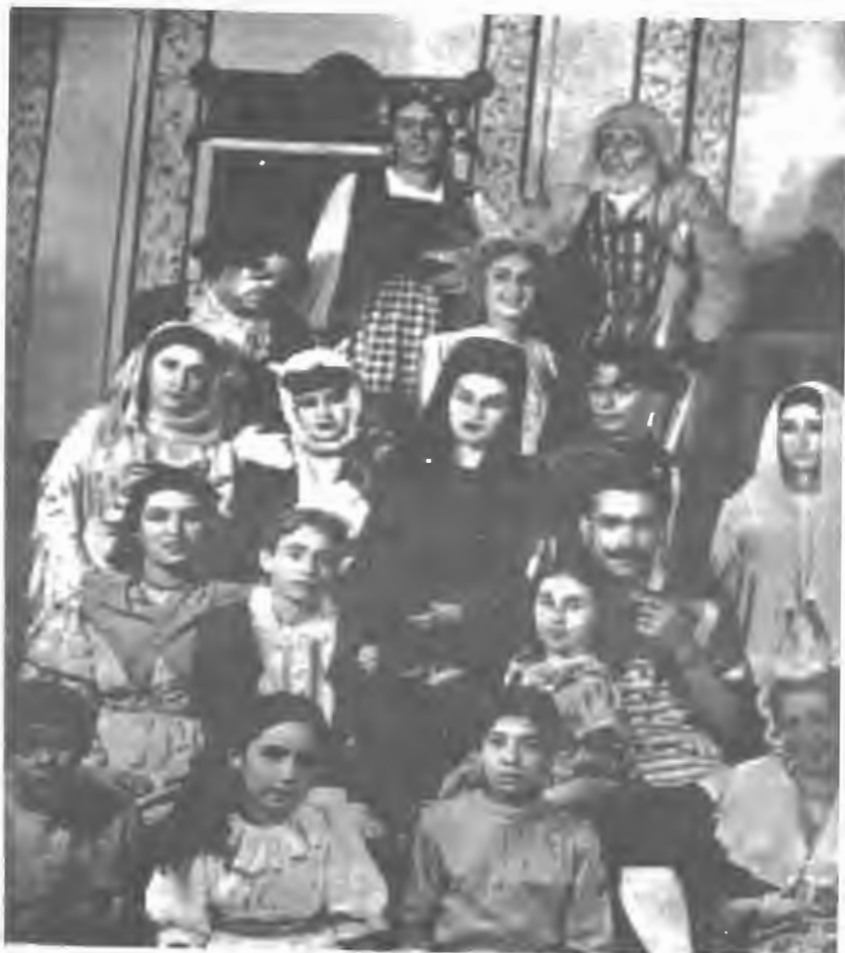
بازیکنان برنده آبی (تئاتر فردوسی - تهران)