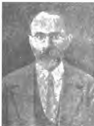
أبو الحسن فروغی