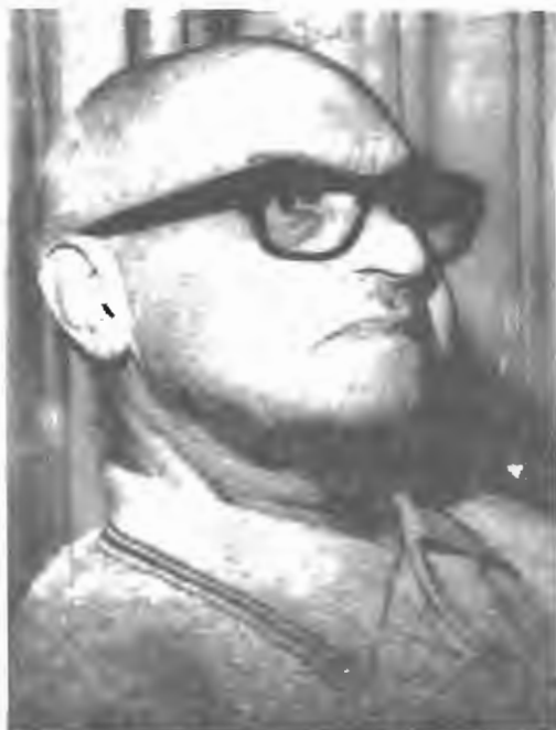
علی نقی وزیر