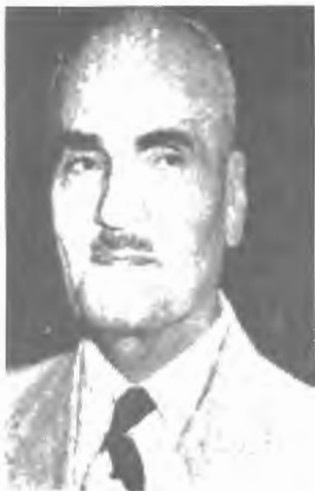
سید حسن تقی زاده