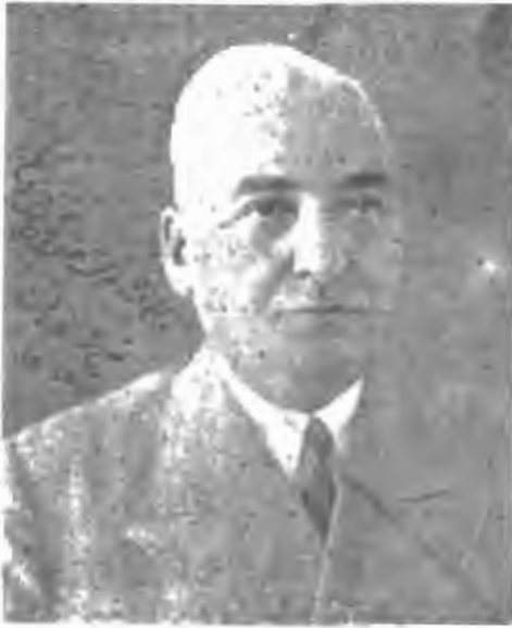
أديب السلطنة سمعي