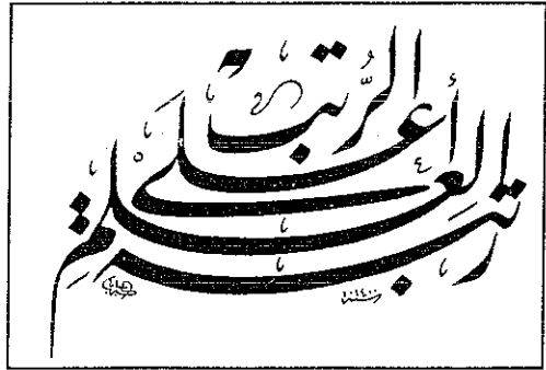
نموذج من خط كامل البجبا

وقد شد الرُحال إلى دمشق، وبغداد، والقاهرة، وشمال إفريقيا، وأمد (ديار بكر)، وإستانبول، وباريس، وإسبانيا، واطلع في المساجد والمتاحف التي زارها على خطوط أثرية ممتعة، وتزوّد في مكتباتها الفنية بمعلومات قيّمة، وشاهد نماذج خطية رائعة، فصورها، وقرأ دراسات فنية تاريخية فلخصها، فكانت حصيلة ذلك كتابه: