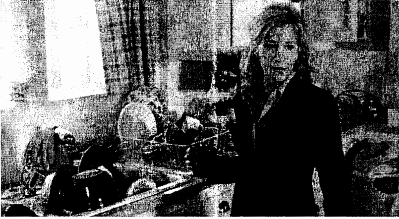
الشكل 6.5: لاينت في زوجات بائسات.

عليها علامات كبر السن الطبيعية ويتقبلن هذا الوضع كشيء طبيعي وعادي، وإذا بدا لنا أن الرجال قد حصلوا على حرية تصويرهم بشكل ومظهر أجسامهم الطبيعي، فإن النساء لا يعتقدن أن هذه الحقبة قد أتت. (أنظر شكل 5 - 6).