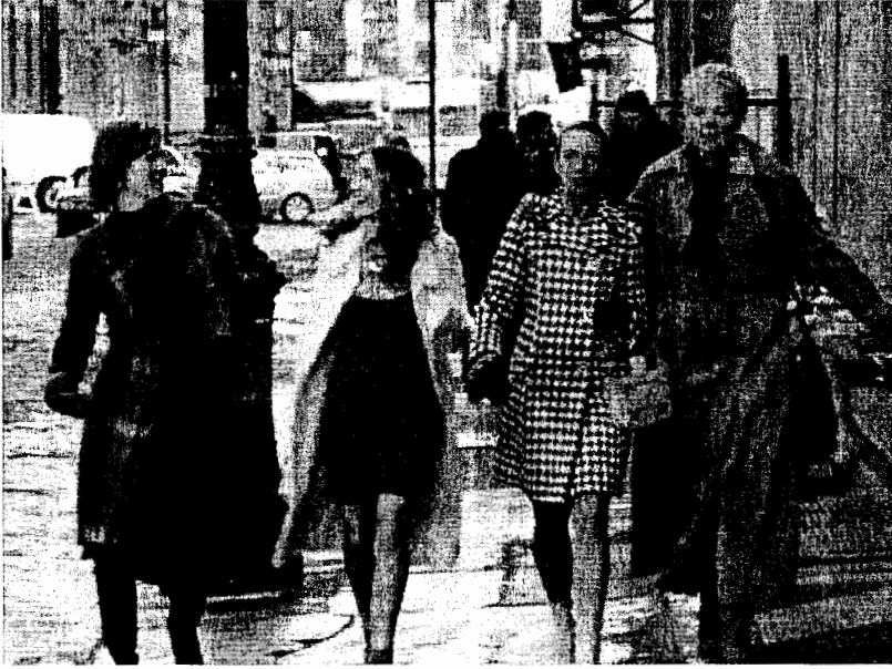
الشكل 4.5: نساء عرض الجنس والمدينة في محطة HBO.

(Dempsy 2003) إنه جزء تكاملي في ثقافة طلبة الكليات، وأصبحت الغالبية العظمى من الدارسين في فصول الإعلام، خلال العشر سنوات الأخيرة، على معرفة تامة بهذا العرض ومنهم الكثيرون من المعجبين به حتى الآن.