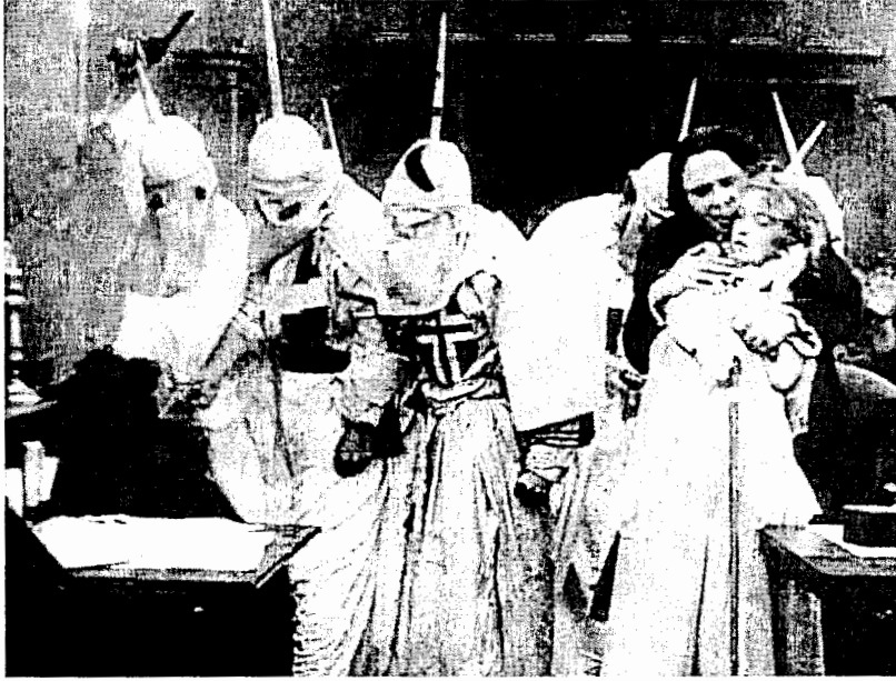
الشكل 7.5، الجمعية السرية تتقذ النساء في رواية د. دبليو. جريفيث «مولد أمة» (1915).

أو معاداة السامية (Gabler 1988; Brodtkin 1989) أو أي أشكال أخرى من أشكال العنصرية أيضاً. (وقريباً Chong 2008; Ono 2008).