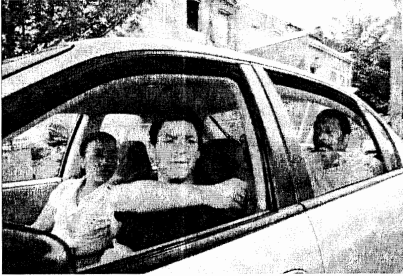
الشكل 1.5 ، سونيا سوهين في دور مفتشة الشرطة شاكيما «كيما» جريجر ، دومينيك ويست في دور ضابط التحريات جيمس «جيمي» ماكانالتي، وكلاارك بيترز في دور ضابط التحريات لستر فريمون في مسلسل «السلك The Wire» بمحطة HBO

الطبقة الوسطى، وعادة أسر قديمة تجنح للمثالية، أو كما أحب الدارسين والعلماء وصف هذه الأسرة كأشخاص سعداء تحيطهم مشكلات سعيدة Spigel 1955. كان ضغط الرعاية يمثل جزءاً كبيراً من هذا الواقع - كانوا يريدون منتجهم مرتبط دائماً بالوفرة والثراء التي تتمتع بها منازل الأمريكيين من الطبقة الوسطى بدلاً من المسلسلات المنخفضة الشعبية مثل The Hoyneymooners أو The Goldbergs اللذين لم يكن لديهما فرصة لبيعهما أو جذب مستهلكين.