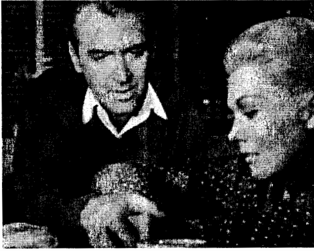
الشكل 5.5: جيمس ستوارت وكيم نوفاك في فيلم هيتشكوك «الدوامة» (1958) (Virtigo).

من المؤكد أن نموذج مالفي مفيد لفهم قوة نص فيلم «الجنس والمدينة» سواء في عرضه التلفزيوني أو في شكله السينمائي. إن النساء في هذا الفيلم وصفتن مالفي كشخصيات تلتزم بقواعد الموضة المثيرة للإعجاب. أما بالنسبة لبطلات هيتشكوك فقد ناقشت مالفي بوضوح الاهتمام الهائل والمركز الموجه لكل تفاصيل الشخصيات النسائية الرئيسية الأربعة - الشعر والملابس، الماكياج، والمظهر عمومًا - حيث تشكل هذه التفاصيل جزءًا هائلًا من موضوع العرض ومدى جاذبيته.