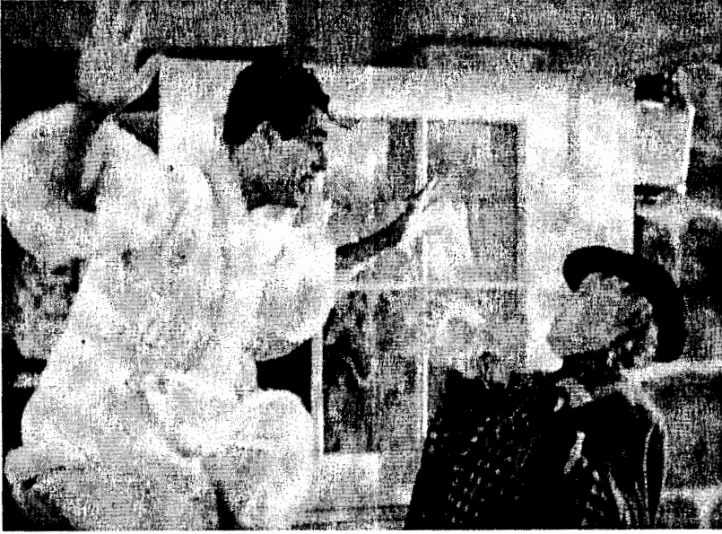
الشكل 9.5، «لقد تحولت فجأة إلى مثلي»: كاري جرانت في حمام كاثرين هيبورن في فيلم Bringing Up Baby 1938.

مع حلول تسعينيات القرن العشرين أصبحت شخصيات المثليين من الأمور العادية في الأفلام المشهورة. مثل «حفل زفاف أفضل أصدقائي» My Best Friend's Wedding 1997، وهو فيلم تقوم ببطولته النجمة المحبوبة جوليا روبرتس التي ظهر أفضل أصدقائها في صورة مثلي واضح مع اهتمام صريح وواضح بالجانب المثلي لشخصيته، وبالمثل فإن الأشخاص المثليين الذين يعلنون عن حقيقتهم قد ظهروا في عدد من الأفلام الأخرى إلى درجة أن الأمر أصبح عادياً ولا يثير أية تعليقات. ومن الأفلام الحديثة الشهيرة فيلم Brokeback Mountain 2005 الذي صور العلاقة بين اثنين من رعاة البقر والتي كانت قائمة في ستينيات وسبعينيات القرن العشرين. يعرض هذا الفيلم بالتفصيل وبوضوح التحامل الاجتماعي ضد المثليين في هذا الوقت، بينما يقدم على المستوى العالمي قصة حب رقيقة بين رجلين كانا بالصدفة من المثليين.