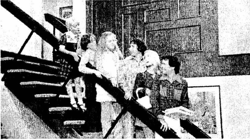
الشكل 2.5، جميع أفراد العائلة الأمريكية في عرض محطة ABC بعنوان The Brady Bunch

الهروب من المناطق الحضرية، وبدأت الحركات المناهضة بالمساواة بين الجنسين وحركات الحقوق المدنية بالتأثير في المجتمع؛ وقد انعكس كلاهما في التغييرات في التلفزيونية في وقت الذروة. صورت عروض كثيرة النساء العازبات في أدوار رئيسية ويظهرن في أوقات الذروة. فمثلاً عرض That Girl ظهر في عام 1965 وهو يتناول موضوع شابة تحاول أن تصبح ممثلة (1965 - 71)؛ وعرض The Mary Tyler Moore Show يصور بطلة عزباء أكثر نضجاً تسعى للحصول على عمل في الصحافة، وظهر في عام 1970 واستمر عرضه خلال عقد كامل (1970 - 1977).