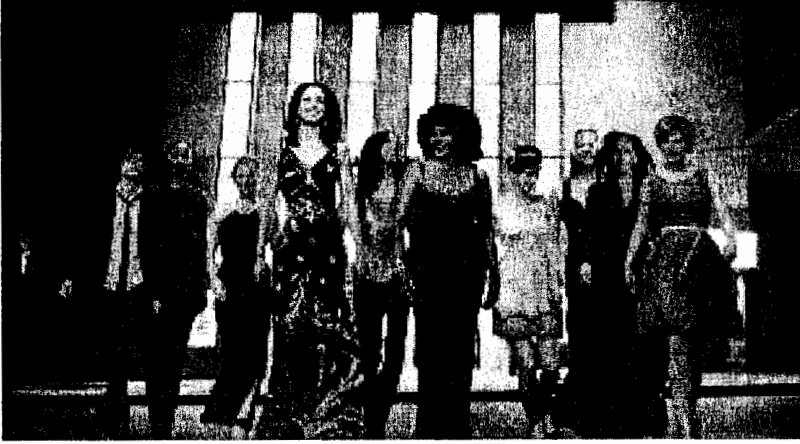
الشكل 10.5 : النساء الفاتحات لعرض The L Word لمحطة شوتايم.

ولكن أكثر ثراءً إلا أن هذا العرض في واقع الأمر قد توجه إلى تمثيل أكثر ديمقراطية ومساواة بالنسبة للسحاقيات على شاشة التلفزيون.