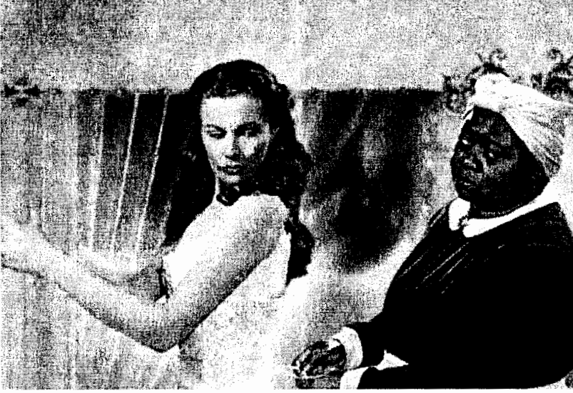
الشكل 8.5: «والآن ما الذي سترتيه يا حملي الصغير؟» تسأل مامي، الذي قامت بأدائه هاتي ماكدانيل، سكارليت الذي لعبت دورها فيفيان لي في عام 1939، في فيلم «ذهب مع الريح» إنتاج مترو جولدن ماير.

التقليدي. وقد اشتهر فيلم «مغني الجاز» كأول فيلم صوتي صنع في هوليوود، ويدور حول قصة مغني يهودي مهاجر يجب أن يختار بين نجاحه الدنيوي في مجال موسيقى الجاز أو متابعة مسيرة والده كقائد لجوقة ترتيل، وهو المغني في الطقوس الدينية اليهودية التقليدية. يصور هذا الفيلم البيض وهم يؤدون أدوارهم بوضع ماكياج أسود على وجوههم والذي كان مألوفاً في أوائل القرن العشرين. إن نجاح هذه الأفلام ومكانتها الأساسية في القانون الكنسي الدراسي لأفلام هوليوود حطت من شأن مناقشة روجين حول أن مركزية العنصرية في منظومة ولغة الأفلام في هوليوود شديدة القوة.