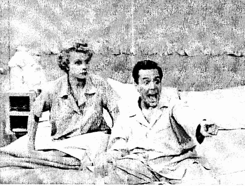
الشكل 3.5: لوسي ريكاردو ربة المنزل الساذجة في مسلسل «أنا أحب لوسي» مع زوجها ريكي ريكاردو، قام بالدورين لوسيل بول وديزي ارماز.