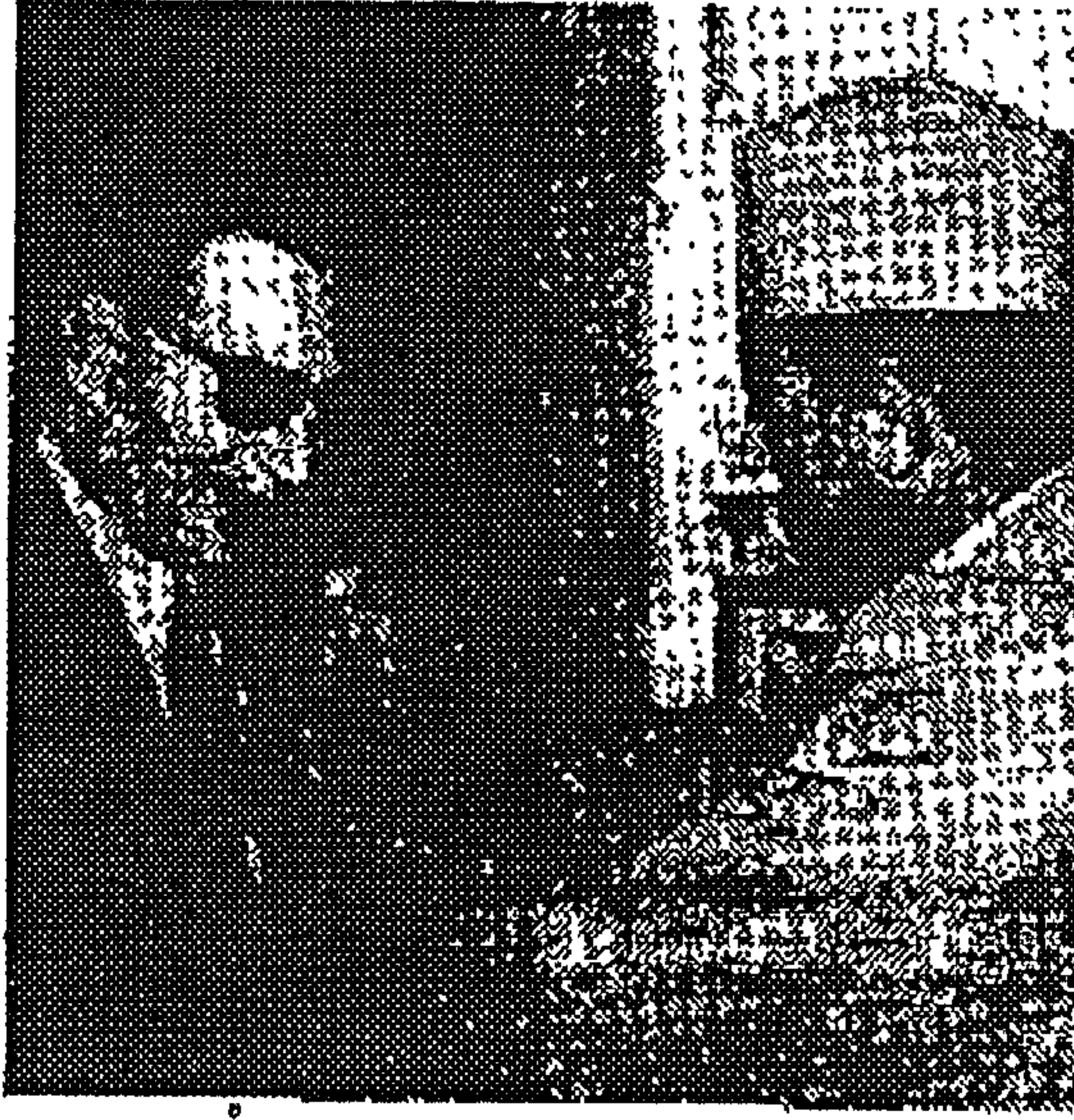
الملك محمد الخامس يقدّم الدكتور طه حسين وسام الكفاءة الفكرية