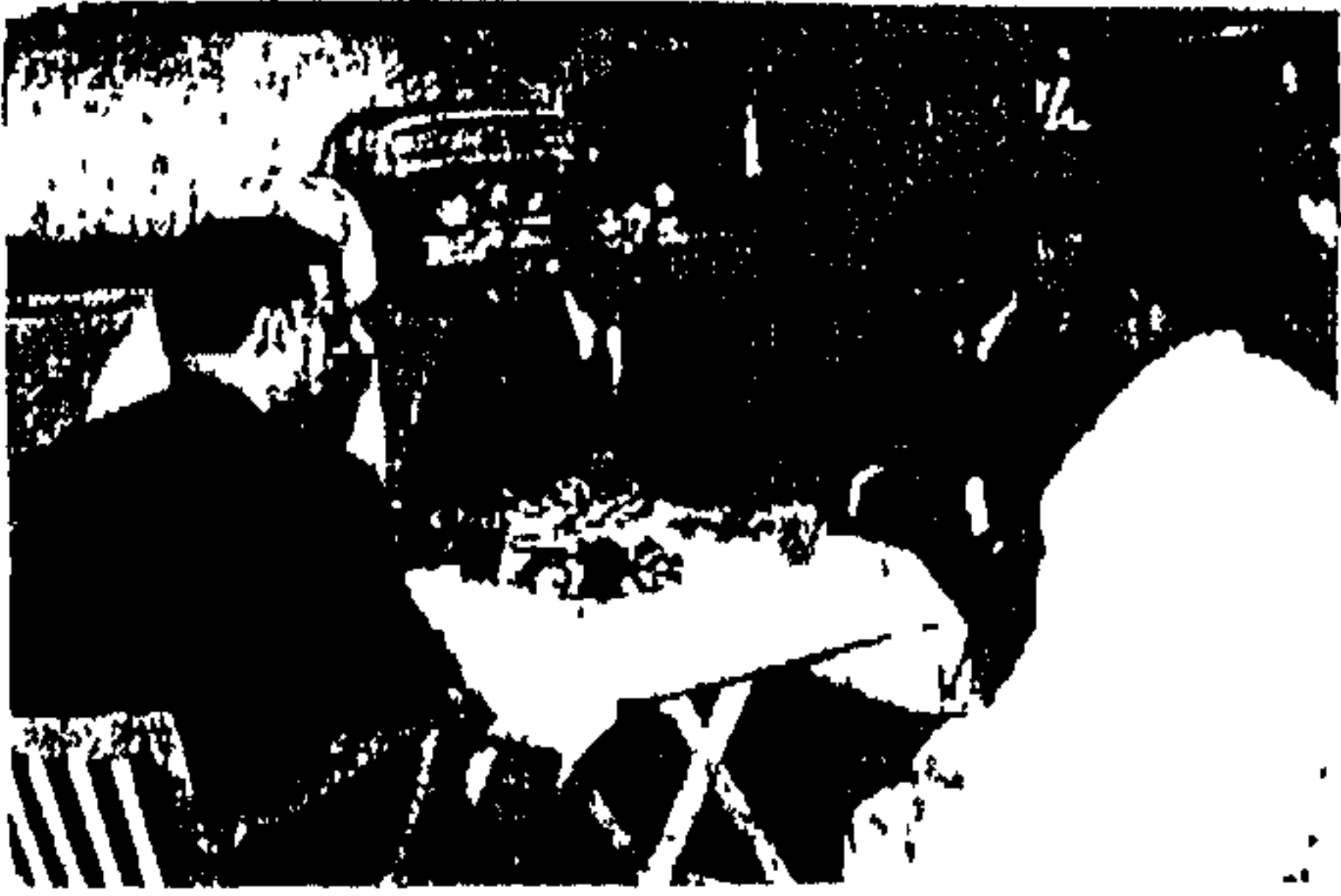
سمو ولي العهد يكرم الدكتور طه حسين