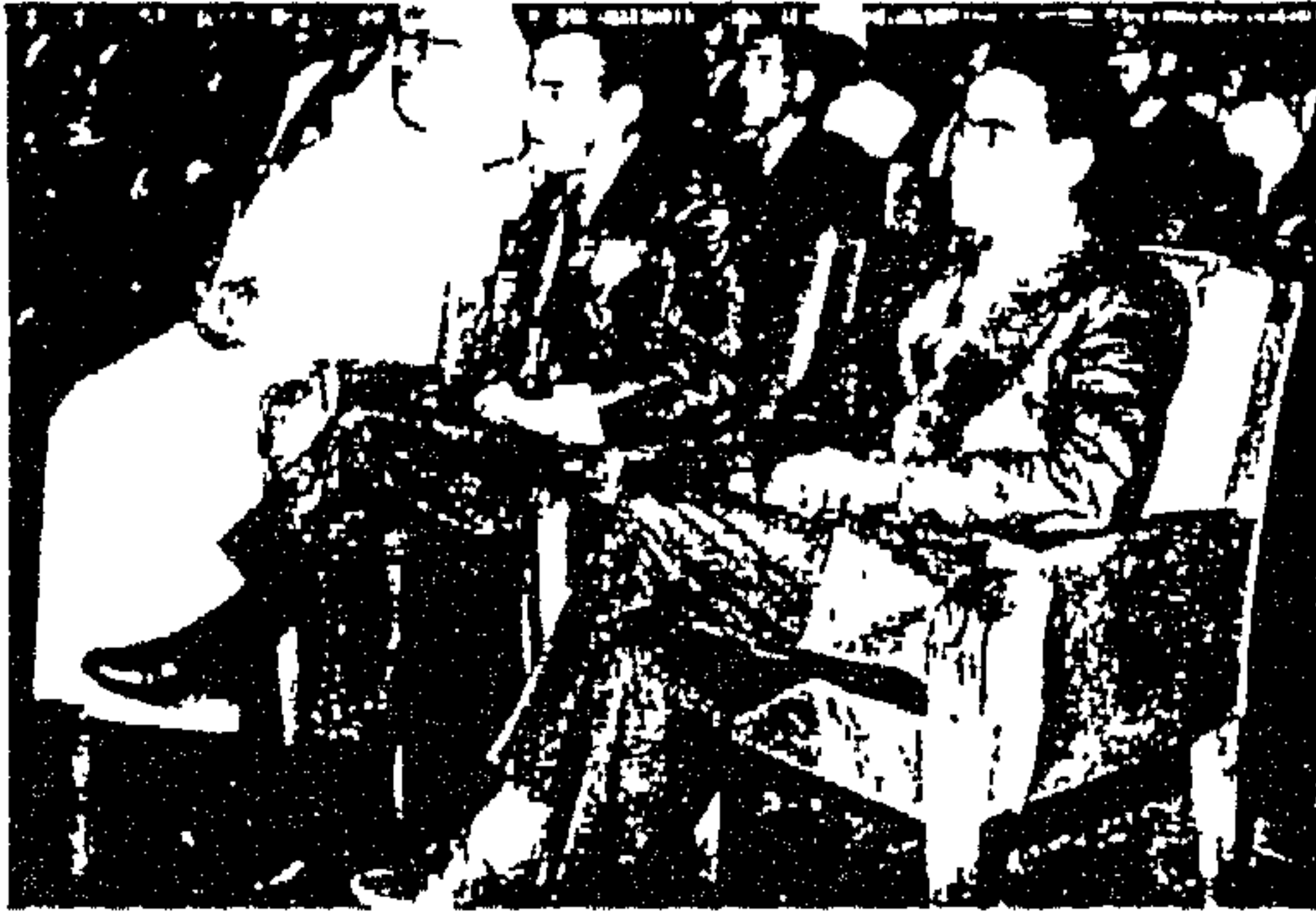
سمو ولي العهد بنو سط السيد محمد اللاني والسيد محمد بنو سة