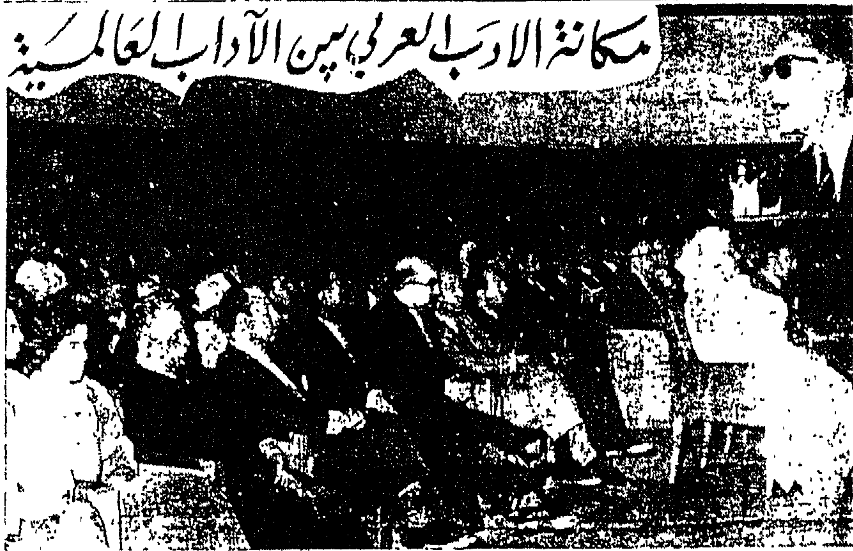
القي الدكتور طه حسين امس في قاعة العلوم بالرباط محاضره فجمه عن مكانه الادب العربي بين الاداب العالميه