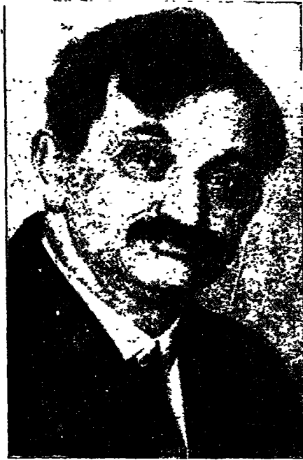
الفيلسوف الالماني الدكتور إيمينول لاسكر ( بقى حائزا بطولة العالم فى لعب الشطرنج من سنة ١٨٩٢ الى سنة ١٩٢١ ميلادية )

« كَأَنَّ » أو الخيال . فالدايرة البيضاوية فى ذاتها ليست معمول « كَأَنَّ » . إنما الدايرة البيضاوية التى تدور عليها الأرض حول الشمس معمول « كَأَنَّ » (١) .