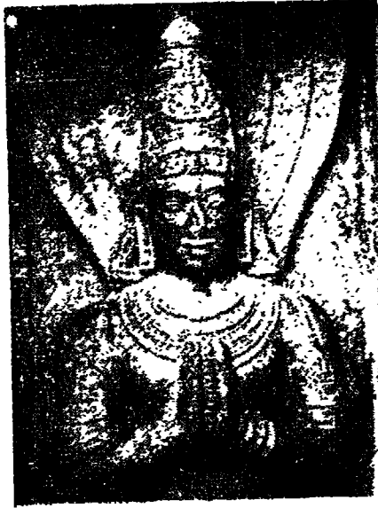
العالم پتان جلی مؤلف یوج سترا

الوصول إليه . ويشرح القسم الثالث منه القوى الخارقة التي يمكن تحصيلها بواسطة ممارسة « يوج » . ويتكلم القسم الرابع منه في طبع النجاة أو الحرية .