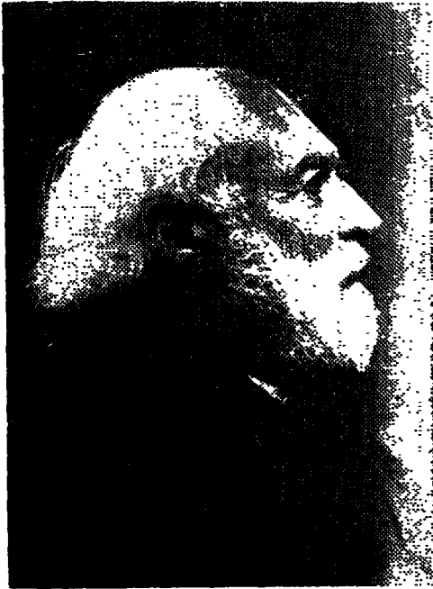
الفيلسوف الالمانى هانزفاىء هنجر

شَنَكَرَا يرى أنها تشمل نظرية المشال ، أى نظرية وجود غير حقيقى ، بينما يرى رَامَنُوج أنها تدل على أن استقلال الحقيقة الخارجية لا يمكن أن يُدرك ، فى حين يرى مادهو أنها تشمل توقف الحقيقة الإيجابية على وجود ذى شخصية . وتحدث إليك الآن عن فلسفة « كَانَّ » عند الفيلسوف الألمانى الشهير هَانز فَايْ هِنَجِر .