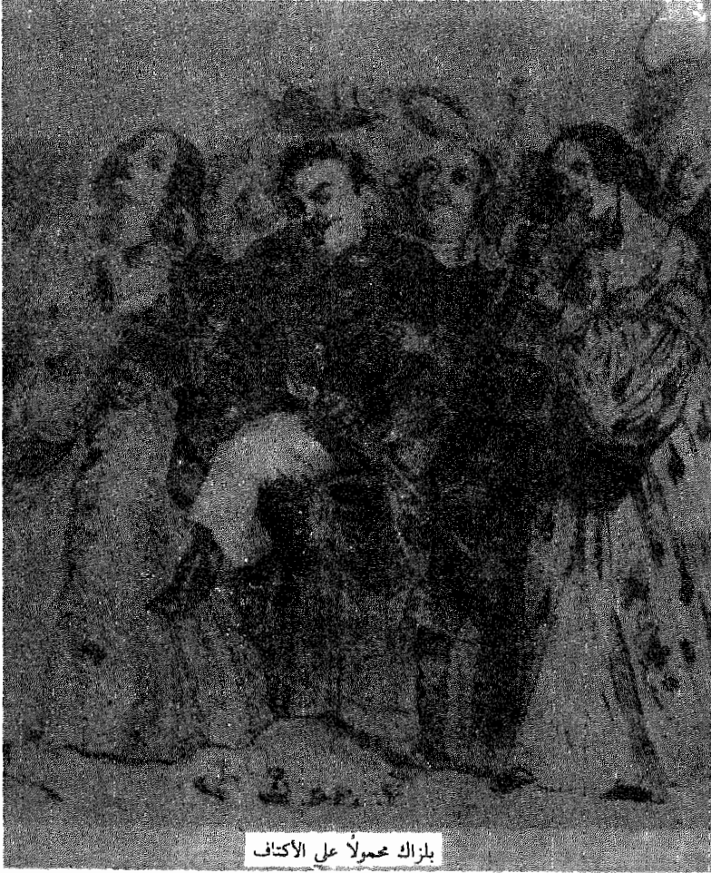
بلزاک محمولاً علی الأكتاف