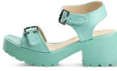
ترافيل، 170 د.إ.ر.س