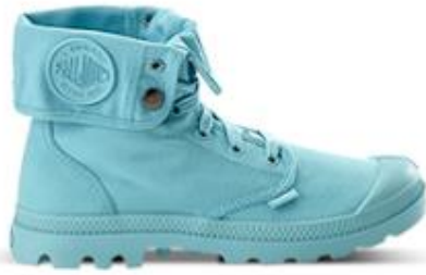
بالديوم، 295 د.إ.ر.س