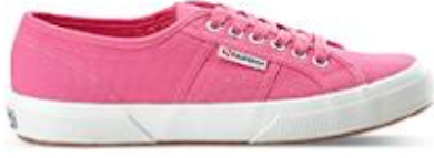
سوبرجا، 245 د.إ.ر.س