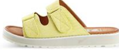
دون تو ارث، 200 د.إ.ر.س