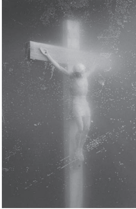
شكل ٤-٢: لوحة «تبؤل المسيح» لأندريس سيرانو. 2

توجد حجة أخرى لمعاملة الفن بوصفه منطقة محمية، وهي أن الفن بطبيعته مجال بشري يقدم اختبارات جادة ومهمة للآراء المسلم بها، فوفقاً لهذا الرأي تكون القيود على الحرية الفنية مضرّة للغاية؛ لأنها تحد من إبداع الأشخاص أنفسهم الذين يحافظون على ثقافتنا حية ومتألمة لذاتها وناقدة لذاتها.