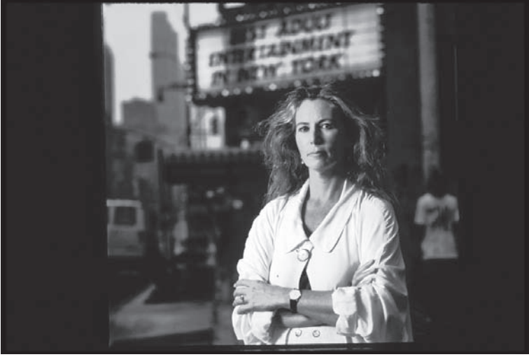
شكل ٤-١: كاثرين ماكينون. 1

أشكال الرقابة سيحدد ما يدخل سوق الأفكار ويسبب الضرر للجميع. يجب أن ينصب اهتمام الحكومة فحسب على ما إذا كان التعبير يسبب ضرراً فعلياً للآخرين أو يحرص عليه.