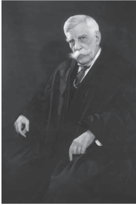
شكل ١-١: أوليفر وندل هولمز الابن، أحد أنصار حرية الكلام، وإن كان مشهورًا بمقولته إنها لا تتضمن حرية الصياح بكلمة «حريق!» في مسرح مزدحم. 1

من منتجات محلية يسهل العثور عليها؟ بالتأكيد في هذا الموقف سيكون من الصائب منعه من إعطاء الوصفة لأحد أو نشرها بأي طريقة أخرى، قليل جدًا من الناس هم من قد يود الدفاع عن حقه في حرية الكلام فيما يتعلق باختراعه الخطير؛ اختراع ليس له أي فائدة واضحة للبشرية وله العديد من الأخطار المحتملة، حتى إن كان المخترع لا يقصد استخدام اختراعه بما يضر الآخرين، فسيظل من الصواب منع هذه المعلومات الخطيرة من الانتشار على نطاق واسع، فإذا كنت تؤمن بأن حرية الكلام ينبغي الدفاع عنها في كل الأحوال، فعليك إذن أن تؤمن بضرورة الدفاع عنها حتى في حالة كهذه.