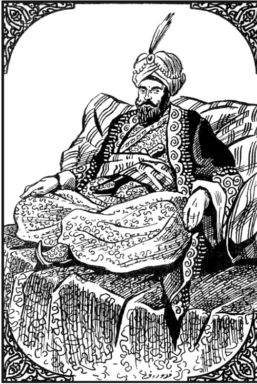
هارون الرشيد على أريكة الخلافة.