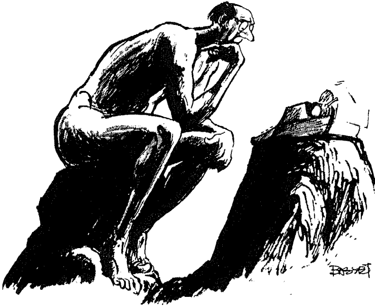
Gene Basset, Scripps-Howard Newspapers

« بریشه چین باسیت - من منصفه سکریس - هاررد »