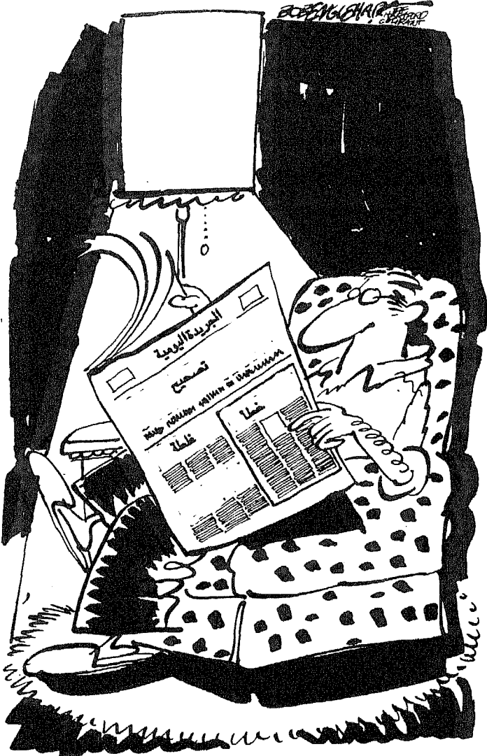
Bob Englehart, The Hartford Courant

« بريشة بوب انجلهارت - من صحيفة ذي هارتفورد كورانت »