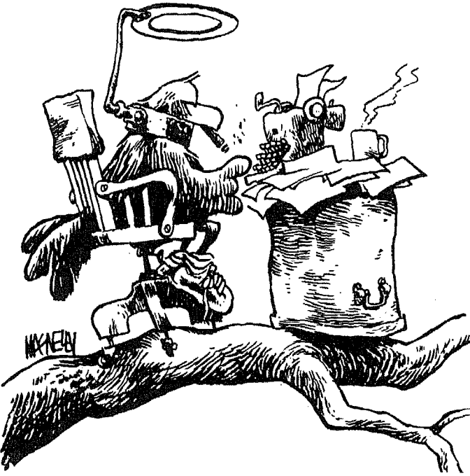
Jeff MacNelly, The Richmond News Leader

« بريشة جيف ماكينالي - من صحيفة ذي ريتشموند نيوز ليدر »