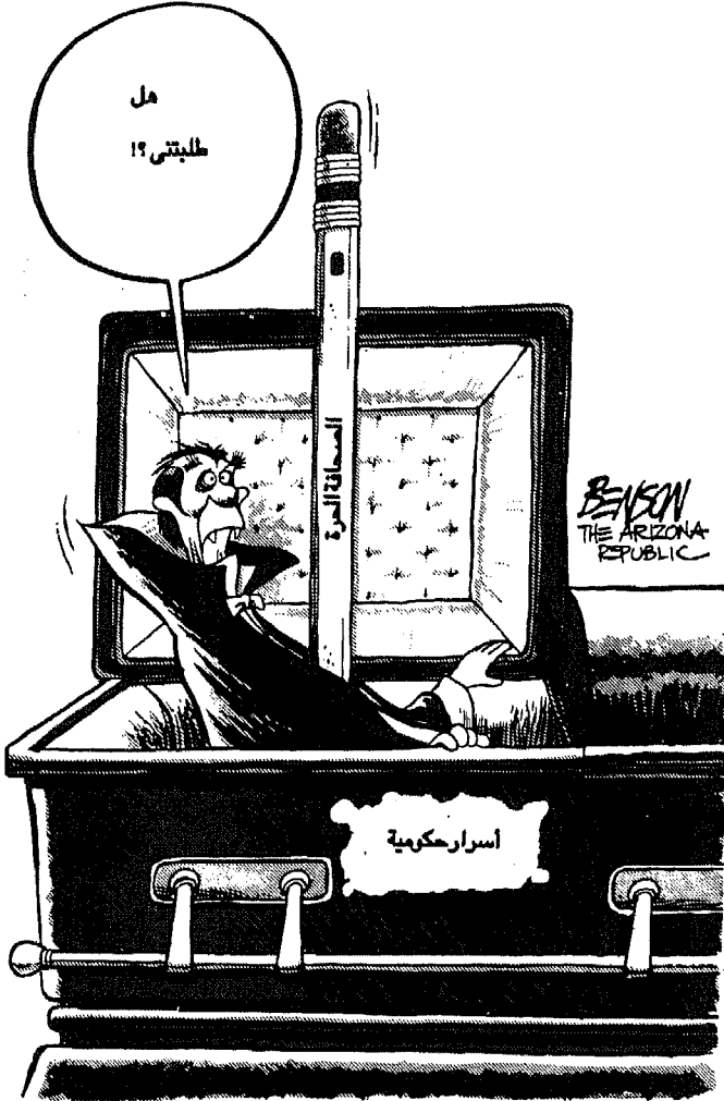
Steve Benson, The Arizona Republic

« بريشة ستيف بنسون - من صحيفة أريزونا ريبابليك »