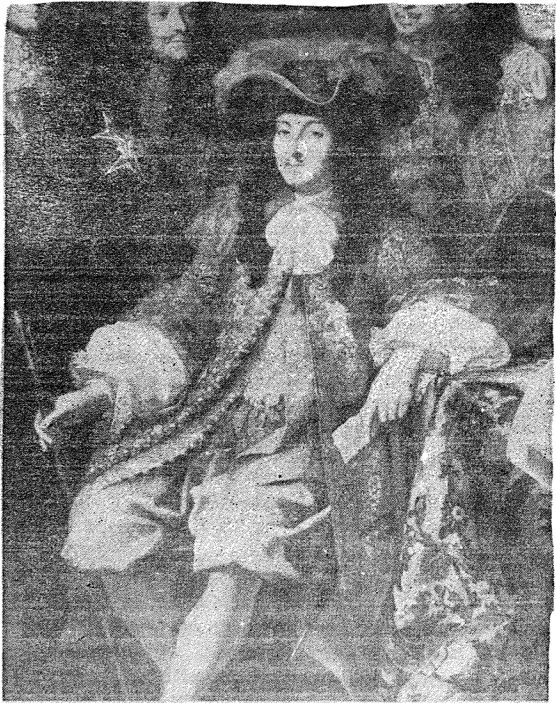
الملك لويس الرابع عشر