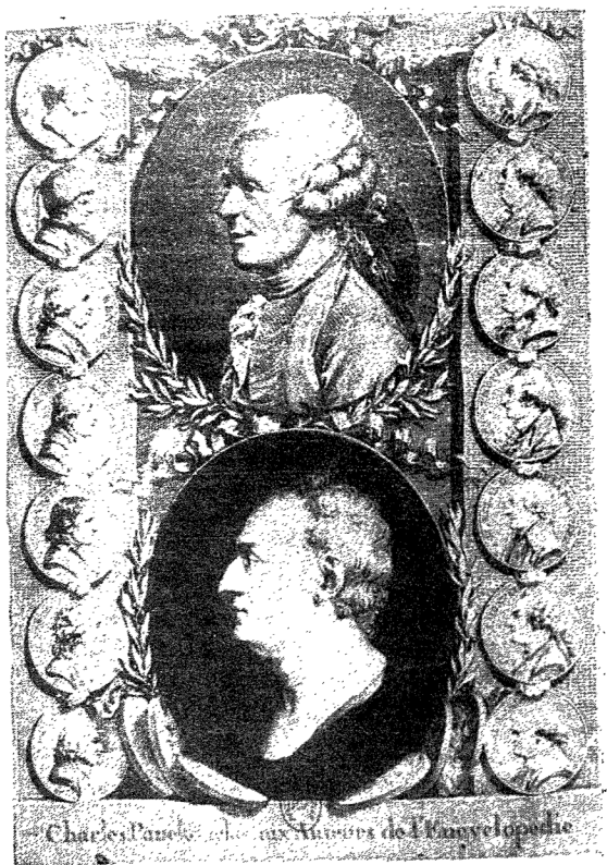
ديترو ( ١٧١٣ - ١٧٨٤ ) وجان دالامبرت ( ١٧١٧ - ١٧٨٣ )