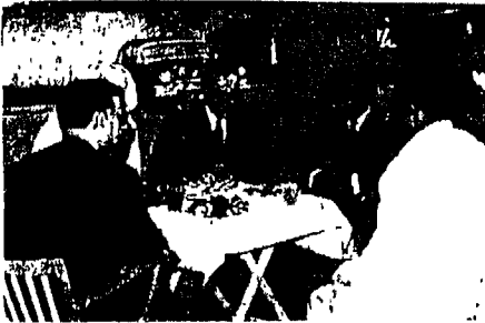
سمو ولي العهد يكرم الدكتور طه حسين