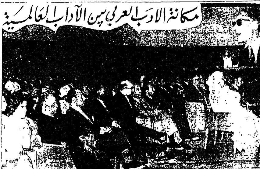
القي الدكتور طه حسين في فاعه العلوم بالرباط محاضره فيه عن مكانه الادب العربي من الاداب العالميه