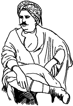
تونسى بملابسه الوطنية

ويلبس الرجال في الواحات القريبة من الساحل غللات سمراء من الصوف ، وعباءات قصيرة ، أما في الواحات الداخلة فيلبسون قطعة من المنسوج الأسمر يلقونها حول أجسامهم كالتوجا