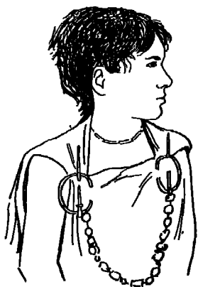
فتاة من اهل واحات تونس