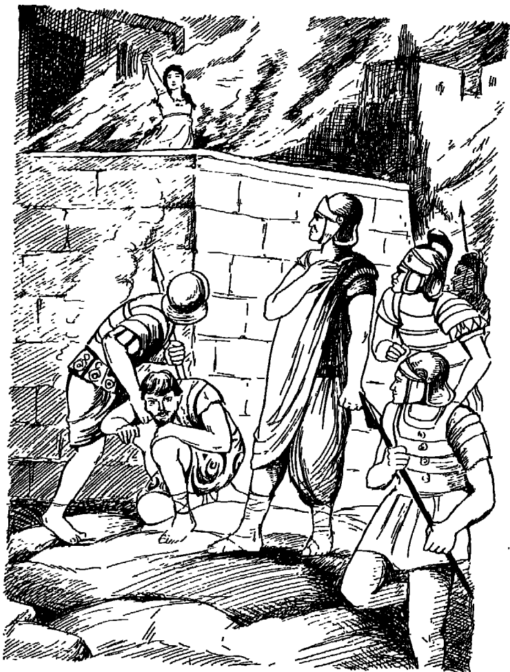
القرطاجنيون يحرقون قرطاجنة ، مفضلين الموت حرقاً على ذل الأسر