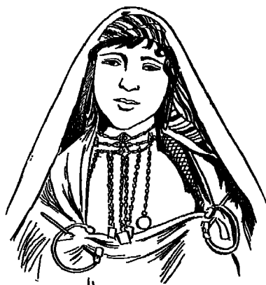
توفسية من سكان البقاع الداخلية