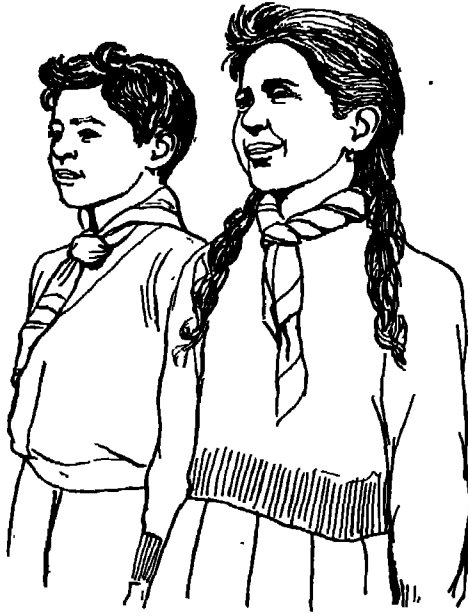
فتى تونسي وفتاة تونسية