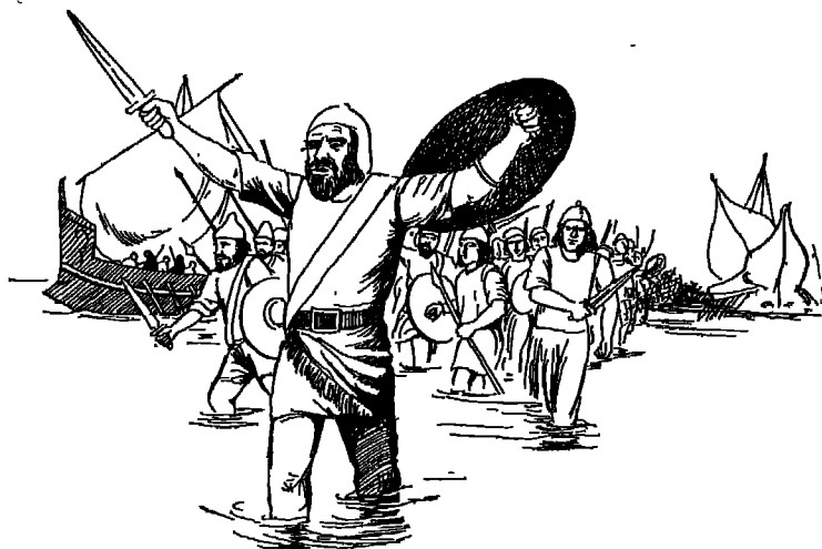
الفيينيقيون ينزلون إلى حيث أنشأوا مدينة قرطاجنة

المجاورة لتلك المراكز أو تسيطر على سكانها ! ولقد شبه بعض الكتاب هذه السياسة التجارية للفينيقيين بسياسة بعض الدول الغربية في الصين قبل نهضتها الأخيرة (١) مع فارق واحد ، وهو أن الفينيقيين ، على الضد من الغربيين ، لم تكن لهم جيوش جرارة ، وأساطيل قوية ، تسارع إلى نجاتهم إذا ما ضيق عليهم الخناق ، أو هددوا بالطرد ، ولهذا كانوا في معظم الأحيان ، إذا ما نشأ خلاف بينهم وبين أمة أجنبية ، أو مع الوطنيين ، ينذر بحرب ، يفضلون هجر المكان على الدخول في نزاع ، لا يعرفون نتائج ، لأنهم كانوا تجاراً ، ولم تكن من مصلحتهم إثارة الحروب التي تبور معها تجارتهم .